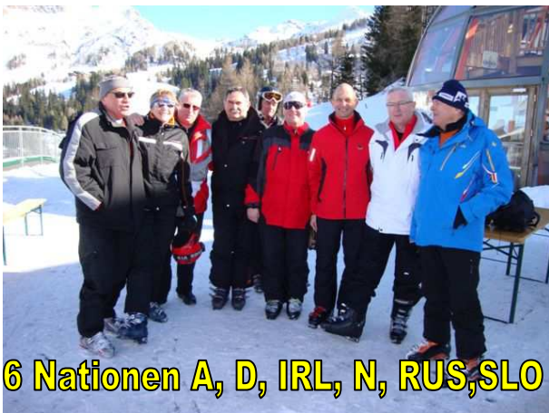
6 Nationen A, D, IRL, N, RUS, SLO