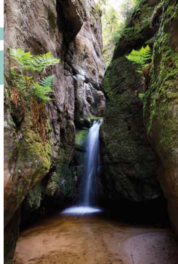
Chute d'eau - Adršpašské skály (Rochers Adršpašské)