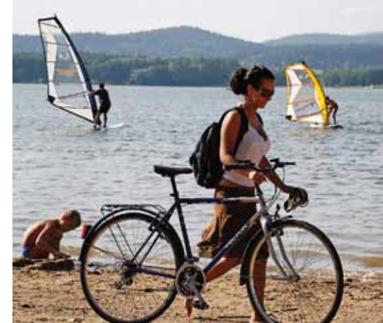
Le lac Lipno

Les « villes rocheuses » représentent de véritables joyaux naturels. Les alpinistes les connaissent intimement, distinguant plus d'un millier de coupes rocheuses auxquelles ils donnent des noms tendres. Soleil, froid, vent et eau sont les éléments qui pendant des milliers d'années se sont concertés pour bâtir le magnifique géoparc européen « Český ráj » (Paradis de Bohême). Le nom est on ne peut plus éloquent, car la variété des beautés naturelles et la richesse du patrimoine – châteaux, châteaux forts, architecture populaire – s'y marient admirablement. Le système d'étangs dans le paysage agricole de la Bohême du Sud constitue un autre centre d'intérêt. La plupart des centaines d'étangs ont été aménagés à l'époque de la Renaissance en tant que réserves d'eau destinées initialement à la culture des fameux poissons tchèques, très sollicités par les tables royales de toute l'Europe.