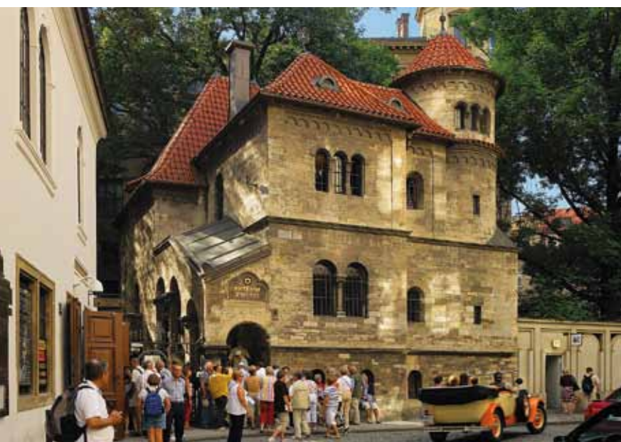
Salle de cérémonie

Prague possède non seulement une quantité impressionnante de monuments historiques, musées, collections d'œuvres d'art, librairies, théâtres, opéras, cabarets, salles de cinéma ou discothèques, mais ses avenues sont aussi fournies en boutiques de vêtements de luxe, magasins de cristal de Bohême, bijouteries, antiquaires, ainsi qu'en restaurants chics, cafés de style, brasseries traditionnelles et bistrots populaires. Fièr de son histoire, la ville de Prague d'aujourd'hui vit jour et nuit au rythme d'une capitale européenne moderne proposant toute une gamme de services, de distractions et de possibilités dans les domaines du commerce et de l'éducation. Dès que vous vous sentirez fatigués, vous n'aurez qu'à vous reposer et profiter de la verdure des parcs pour faire un peu de sport ou une balade. A moins que vous préféreriez partir en excursion :