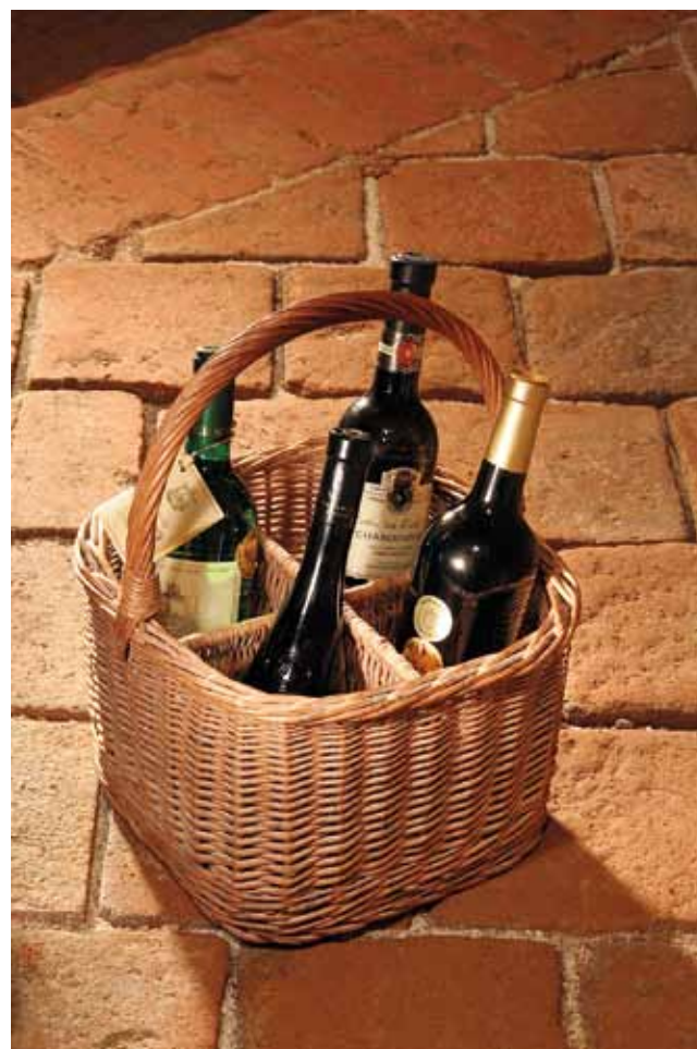
Découvrez – les!