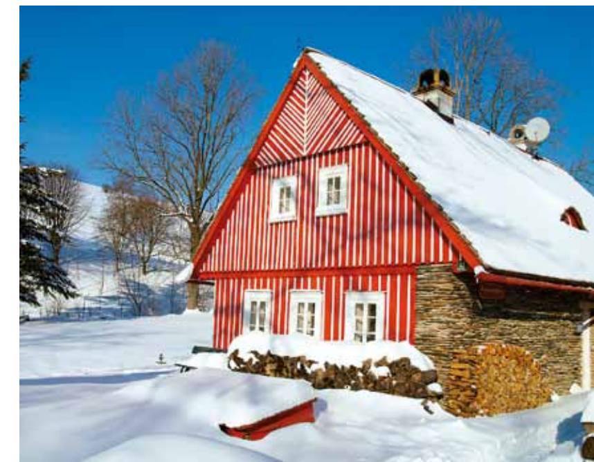
Chalet montagnard dans les Monts des Géants