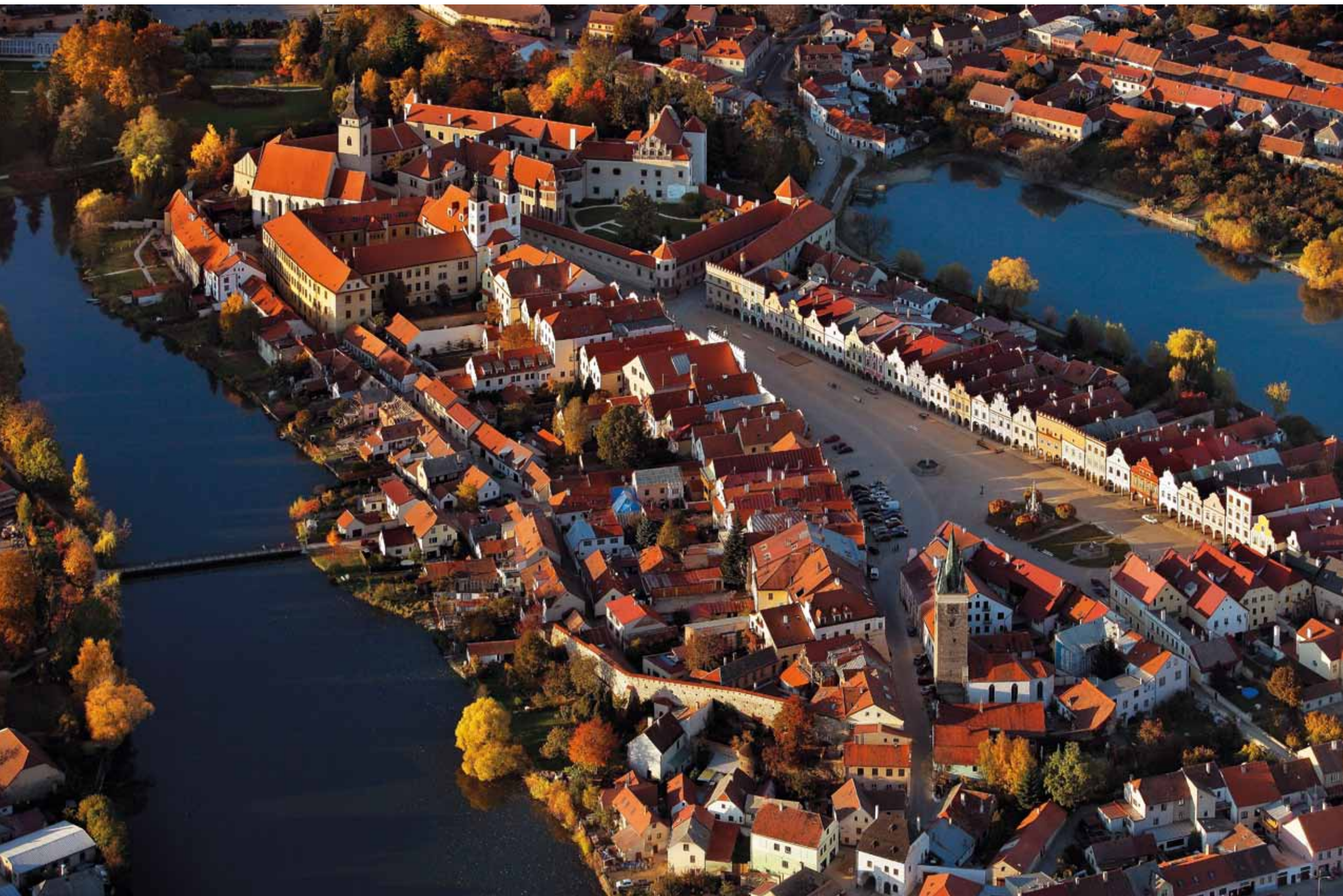
Vue aérienne sur la ville historique de Telč