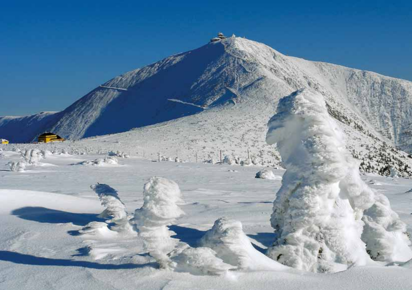
Le Mont Sněžka - le point culminant de la République tchèque