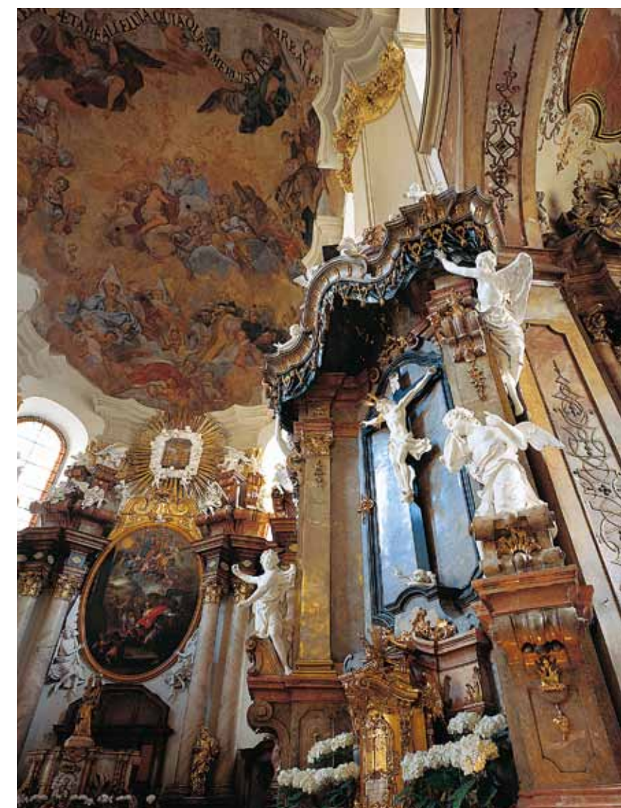
Intérieur d'une église d'Olomouc