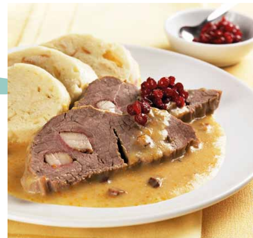
„Svičková s knedlíky“, filet de boeuf à la crème