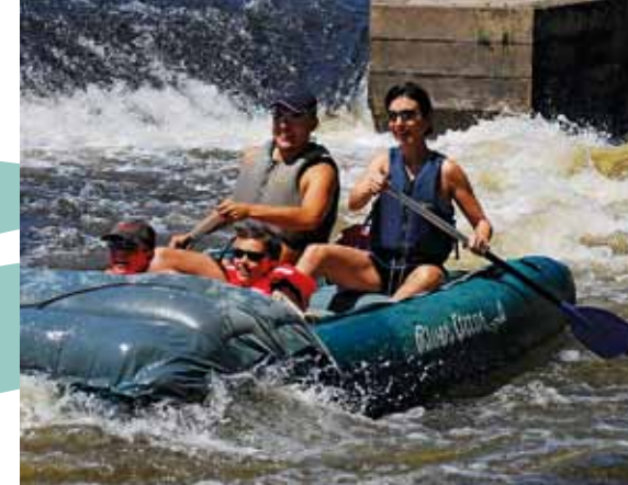
Descente de la rivière Vltava à Vyšší Brod