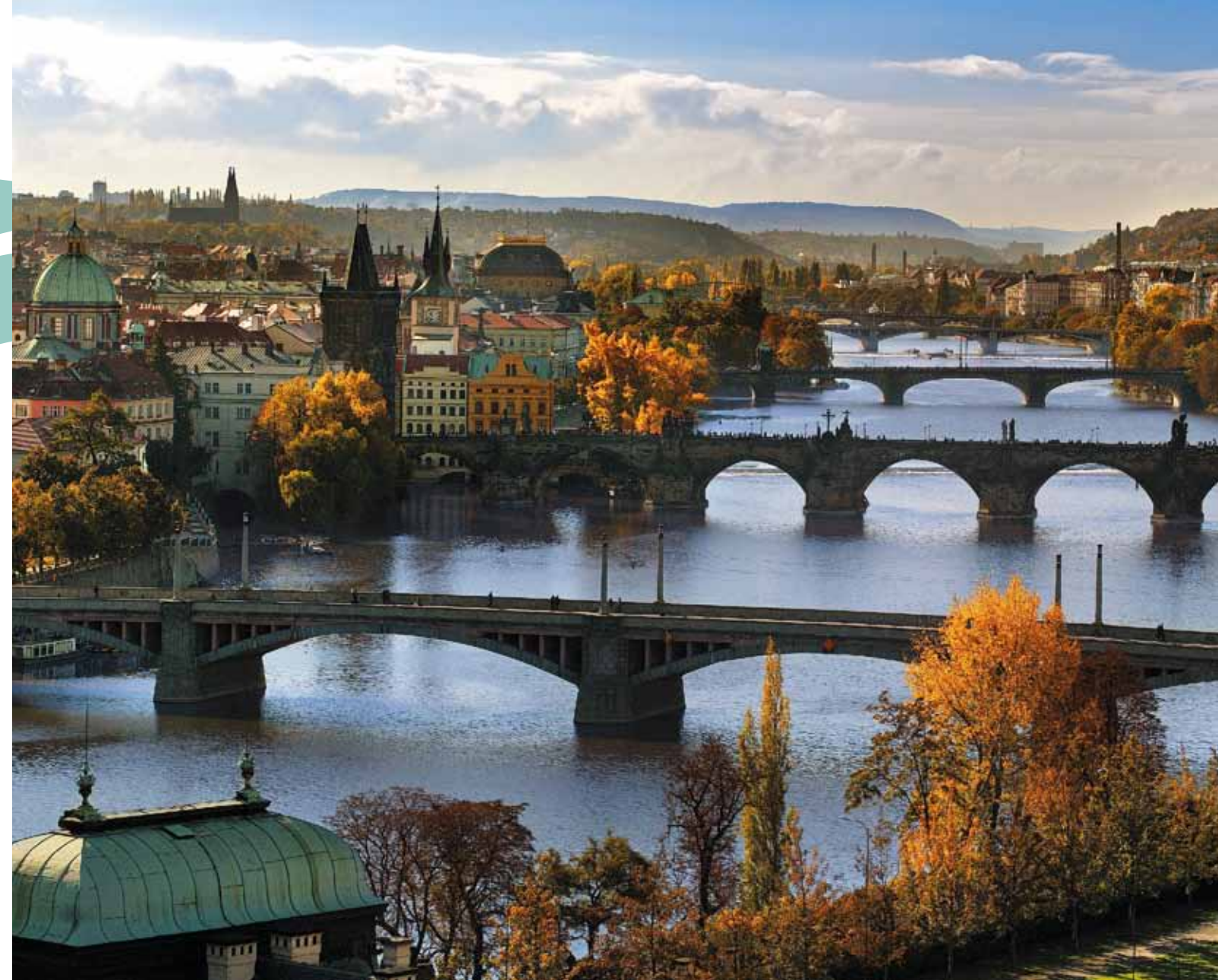
Ponts de Prague

Nelahozeves – château Renaissance avec de beaux intérieurs [ www.lobkowiczevents.cz ]