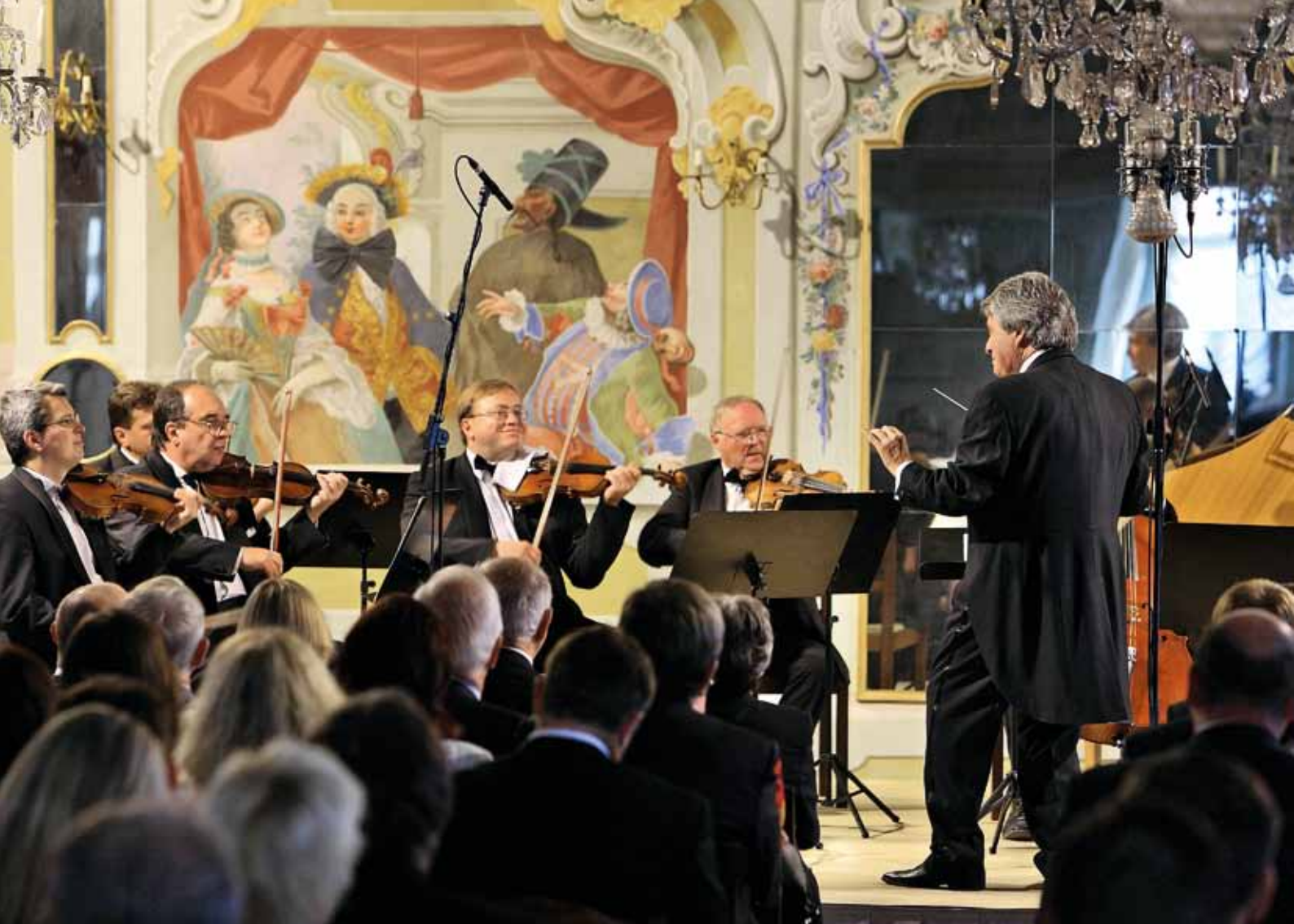
Festival international de musique à Český Krumlov