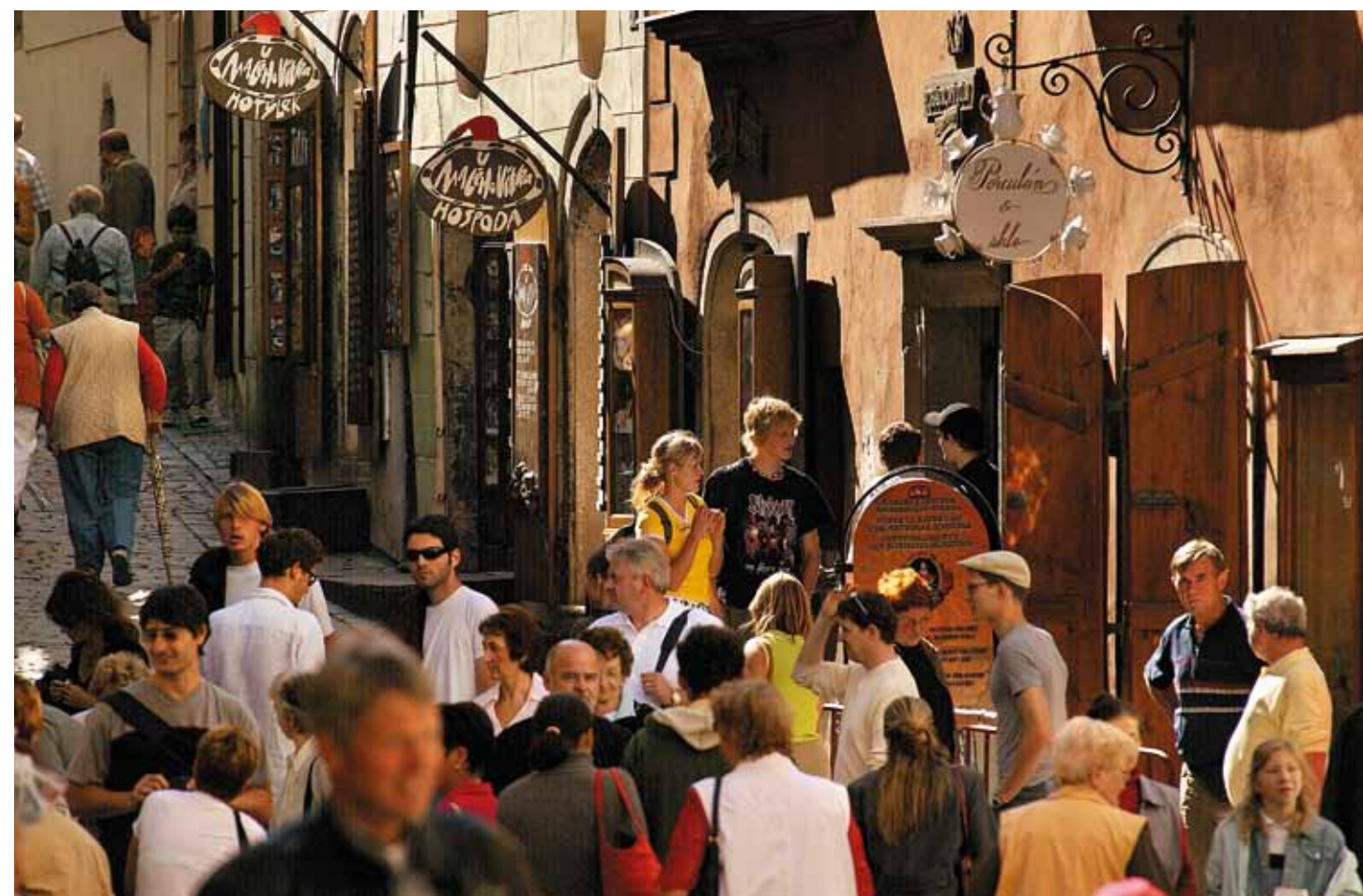
Rue Radniční (rue de l'Hôtel de ville) à Český Krumlov

Fête des vendanges historique de Znojmo – fête des vendanges costumée [ www.znojmo.eu ]