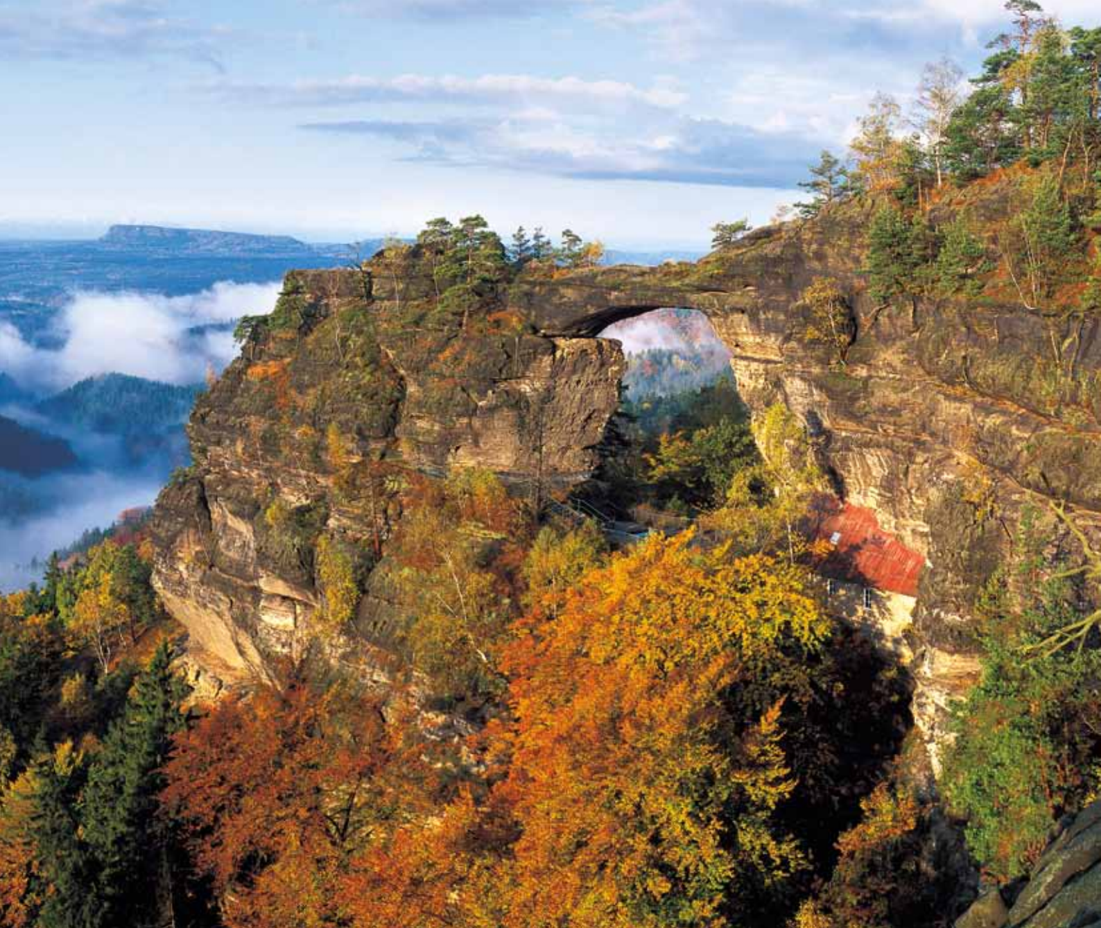
Porte de Pravčice