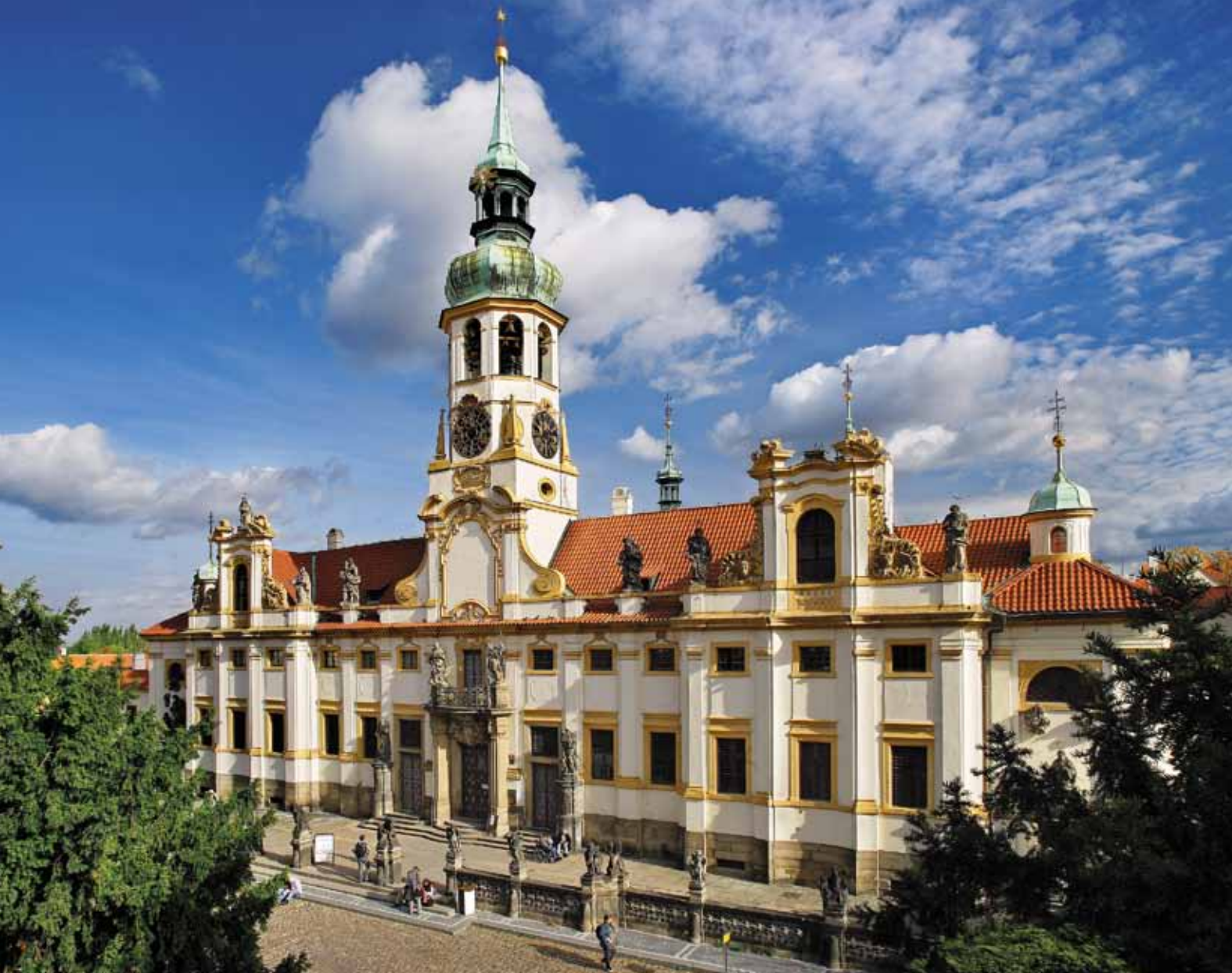
Notre-Dame de Lorette