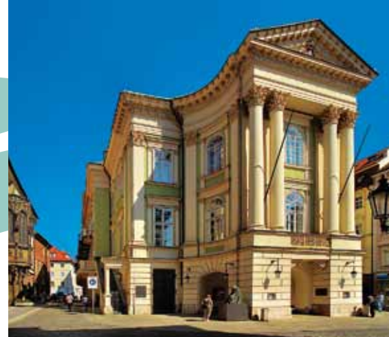
Théâtre des Etats

comme la Galerie du Château de Prague, la Galerie nationale ou le Musée national, la République tchèque peut se targuer de posséder des centaines de musées ethnographiques ou thématiques, ainsi que des monuments dédiés à des personnalités importantes qui font la fierté des habitants des petites villes et des petites communes.