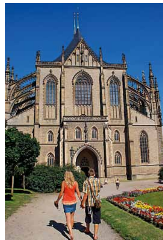
Cathédrale Sainte-Barbe à Kutná Hora

Eglise Saint-Jean-Népomucène à Žďár n.S. [ www.zamekzdar.cz ]