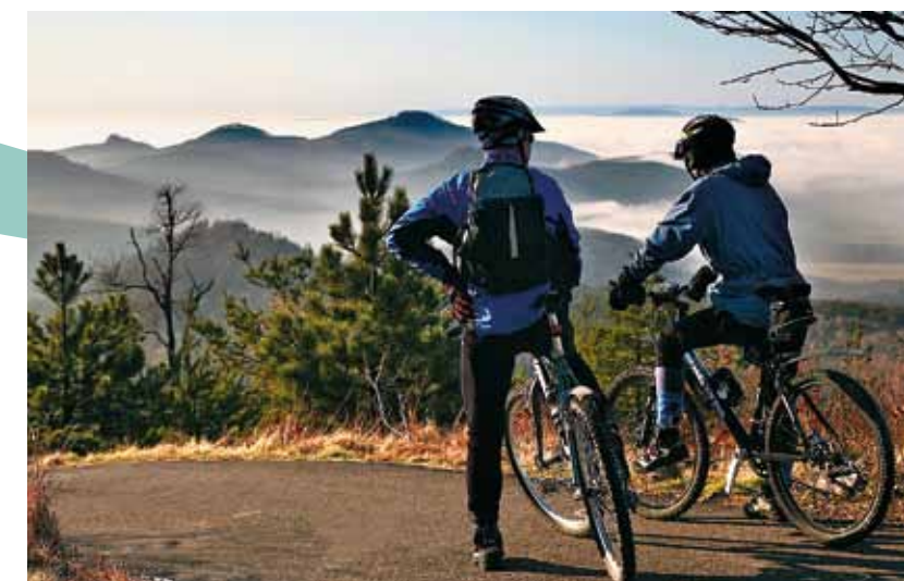
Cyclisme en montagne