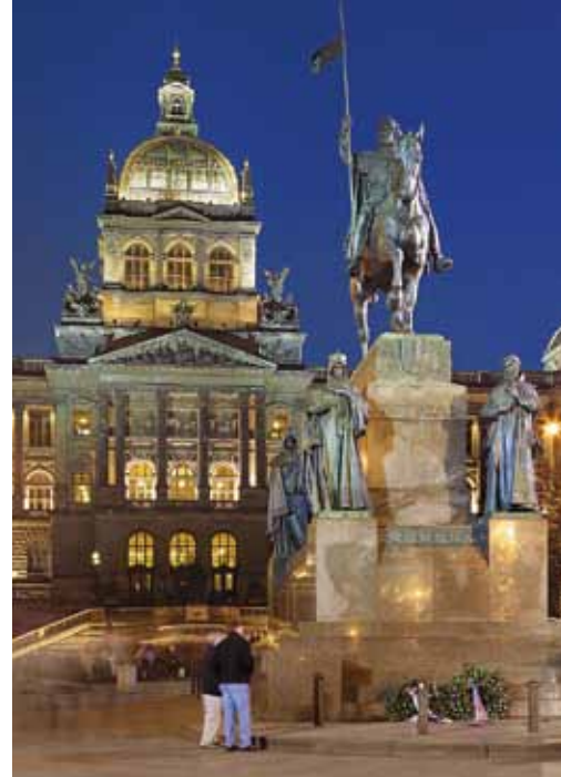
Bâtiment du Musée et statue de saint Venceslas

Prague possède non seulement une quantité impressionnante de monuments historiques, musées, collections d'œuvres d'art, librairies, théâtres, opéras, cabarets, salles de cinéma ou discothèques, mais ses avenues sont aussi fournies en boutiques de vêtements de luxe, magasins de cristal de Bohême, bijouteries, antiquaires, ainsi qu'en restaurants chics, cafés de style, brasseries traditionnelles et bistrots populaires. Fièr de son histoire, la ville de Prague d'aujourd'hui vit jour et nuit au rythme d'une capitale européenne moderne proposant toute une gamme de services, de distractions et de possibilités dans les domaines du commerce et de l'éducation. Dès que vous vous sentirez fatigués, vous n'aurez qu'à vous reposer et profiter de la verdure des parcs pour faire un peu de sport ou une balade. A moins que vous préféreriez partir en excursion :