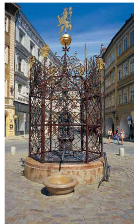
Fontaine sur Malé náměstí (Petite place)