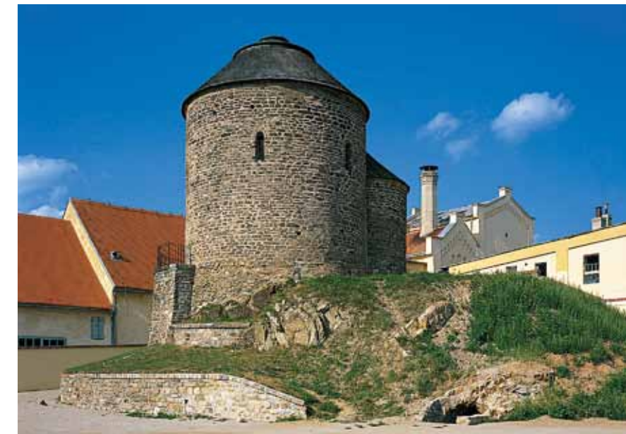
Rotonde Sainte-Catherine à Znojmo