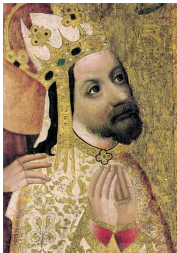
Tableau votif de Charles IV