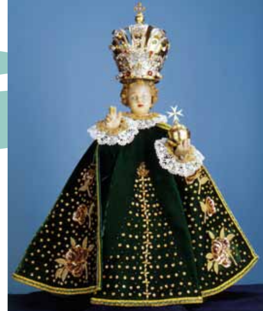
L'Enfant Jésus de Prague

Depuis le Moyen-âge, le clergé catholique et les ordres religieux étaient parmi les investisseurs les plus généreux de Bohême. Le monastère de Vyšší Brod et sa magnifique bibliothèque baroque, l'église Sainte-Barbe – patronne des mineurs de Kutná Hora, le lieu de pèlerinage à Zelená hora près de Žďár nad Sázavou, le siège archiepiscopal estival et ses jardins à Kroměříž, ne sont que quelques exemples d'architectures magistrales qui sont disséminées dans tout le pays. De nombreux témoignages illustrent les douze siècles écoulés, où la foi chrétienne allait de pair avec l'évolution politique et sociale des pays tchèques, laissant son empreinte sur le charmant paysage, dans chaque ville et dans chaque village. On citera : des églises monumentales et de simples églises de campagne, des monastères somptueux et des chapelles modestes, des lieux de pèlerinage majestueux sur des collines visibles de loin, des résidences splendides abritant des collections magnifiques ou encore une simple croix entre deux tilleuls au milieu des champs.