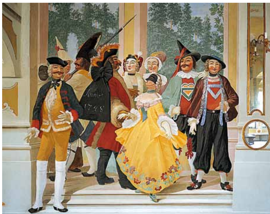
Décoration de la Salle des Masques au château de Český Krumlov

Ce ne sont pas seulement les souverains tchèques, mais aussi les familles nobles, locales et étrangères, ainsi que les bourgeois devenant de plus en plus influents, qui aimaient afficher leur pouvoir et leur richesse. Une quarantaine de villes tchèques ont gardé intacts leurs centres historiques qui sont désormais classés monuments historiques. Dans chaque ville, grande ou moins grande, on peut découvrir des monuments bien conservés et dignes d'intérêt, ainsi que des joyaux d'architecture. On notera en premier lieu Český Krumlov, remarquable ville de styles gothique et Renaissance, avec d'étroites ruelles médiévales et un grand château qui surplombe la rivière (le