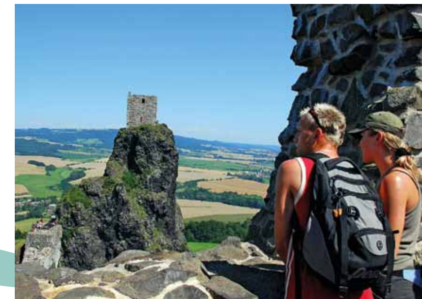
Vue sur le paysage depuis le château de Trosky