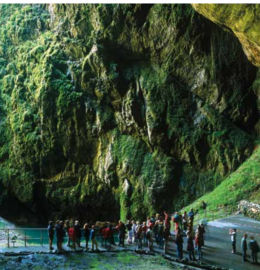
Gouffre de Macocha

Les images satellites de l'Europe centrale montrent un bassin flagrant, entouré d'une chaîne de montagnes : la République tchèque. Les montagnes suivent une grande partie des frontières de l'Etat, tandis qu'à l'intérieur du pays, on découvre un paysage très varié et accidenté. Des côtes légèrement ondulées alternent avec des plaines fertiles le long des rivières, avec des forêts profondes et des régions richement peuplées.