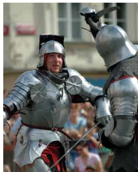
Duel de chevaliers

Une quantité extraordinaire de près de deux mille châteaux, châteaux forts, forteresses et vestiges font partie intégrante du paysage tchèque. En été (ou parfois pendant toute l'année), environ deux cent d'entre eux sont rendus accessibles pour des visites guidées par leurs propriétaires, qu'il s'agisse de l'Etat ou de particuliers, pour la plupart descendants d'illustres familles nobles. Certains sont d'excellents exemples d'une architecture raffinée, comme en témoignent les châteaux gothiques de Bezděz, Pernštejn, Locket, Kost ou les châteaux Renaissance à