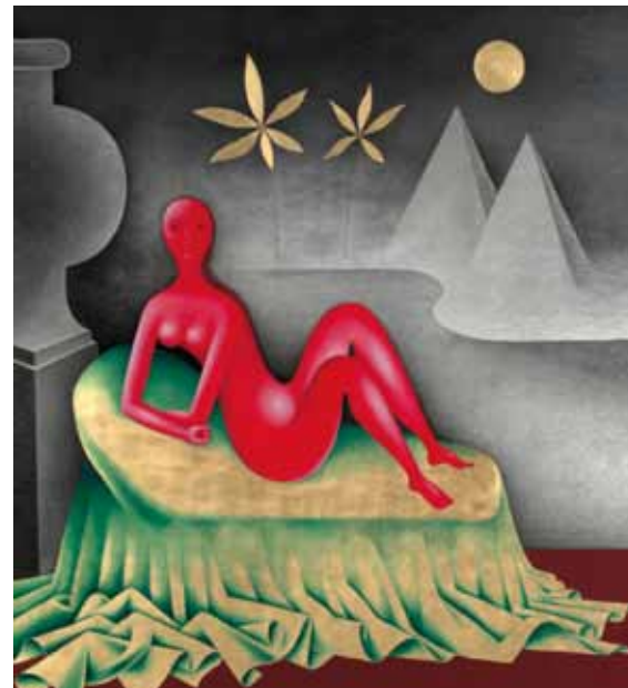
Galerie nationale : Jan Zrzavý – Cléopâtre