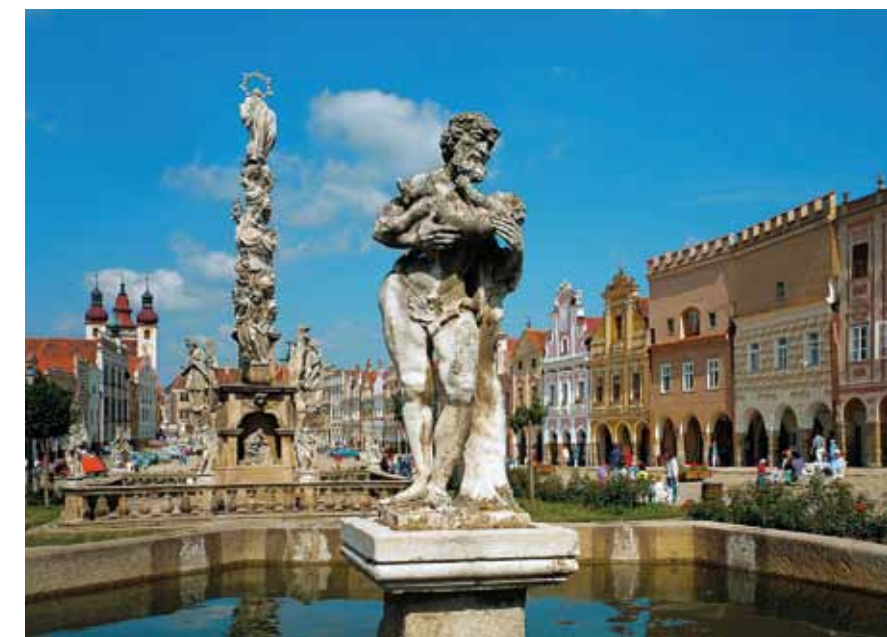
Place à Telč →