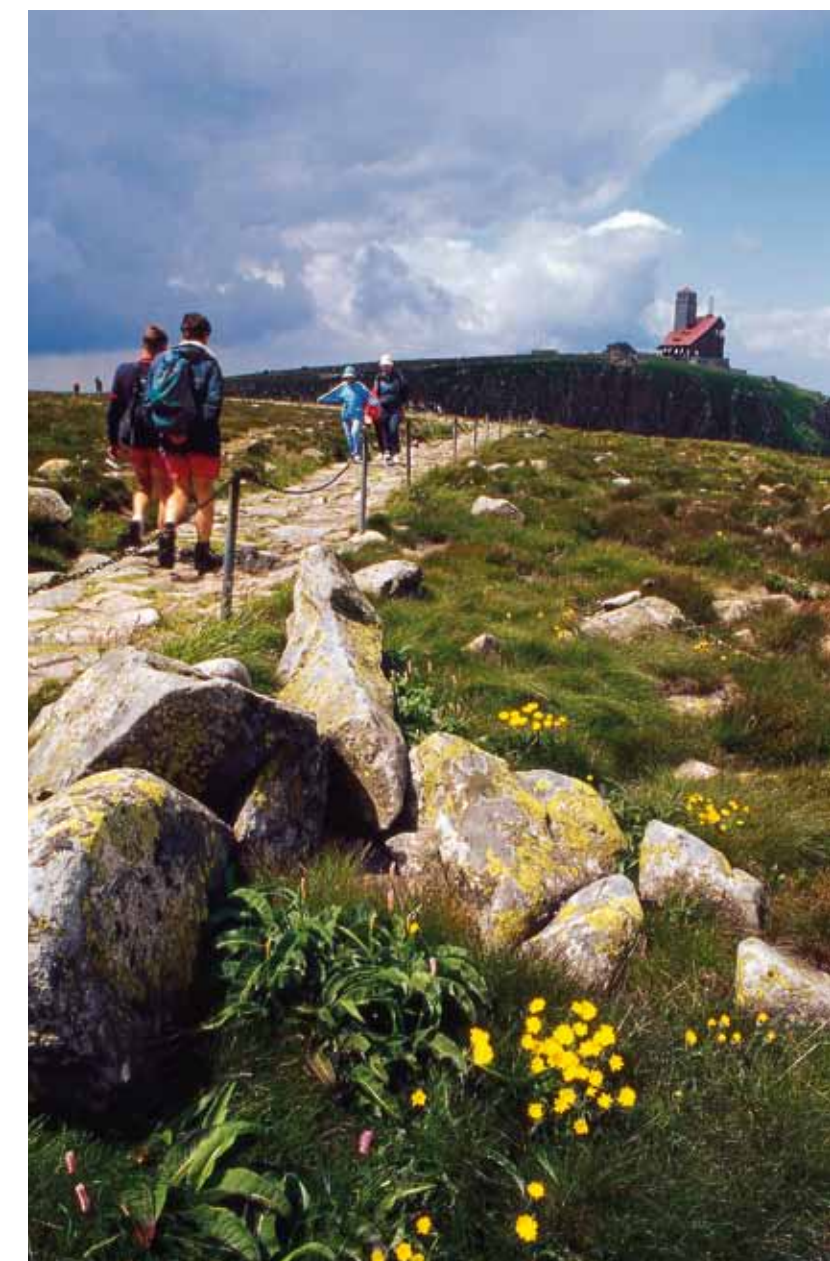
Monts des Géants - Sněžné jámy