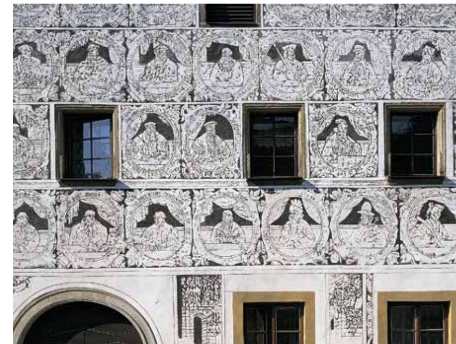
Détail de la façade d'une maison bourgeoise à Slavonice