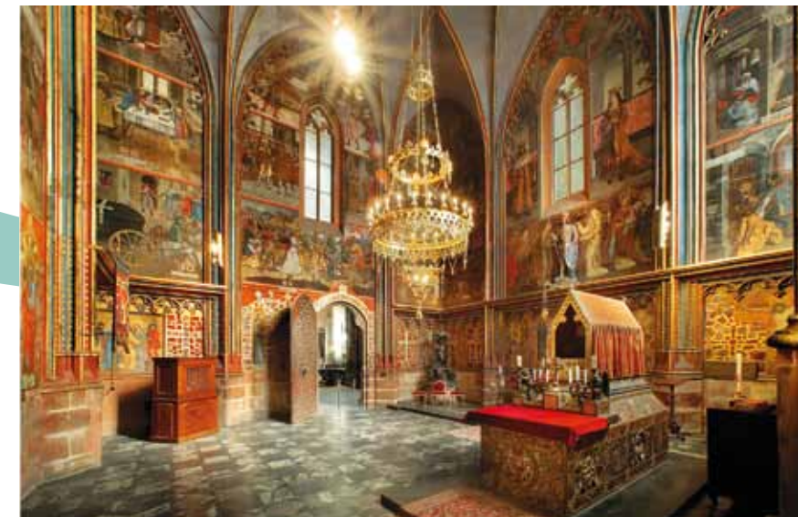
Chapelle Saint-Venceslas, patron des pays tchèques