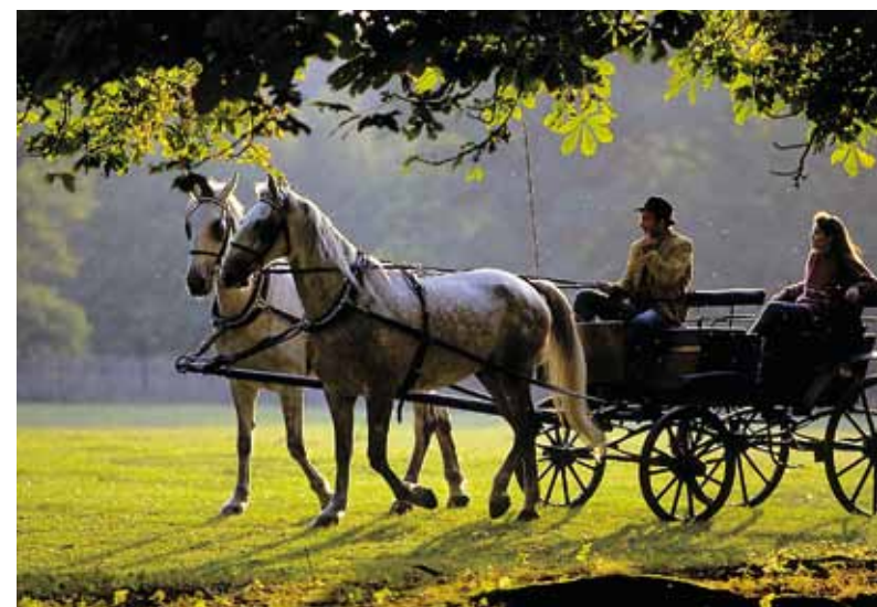
Promenade en voiture à chevaux