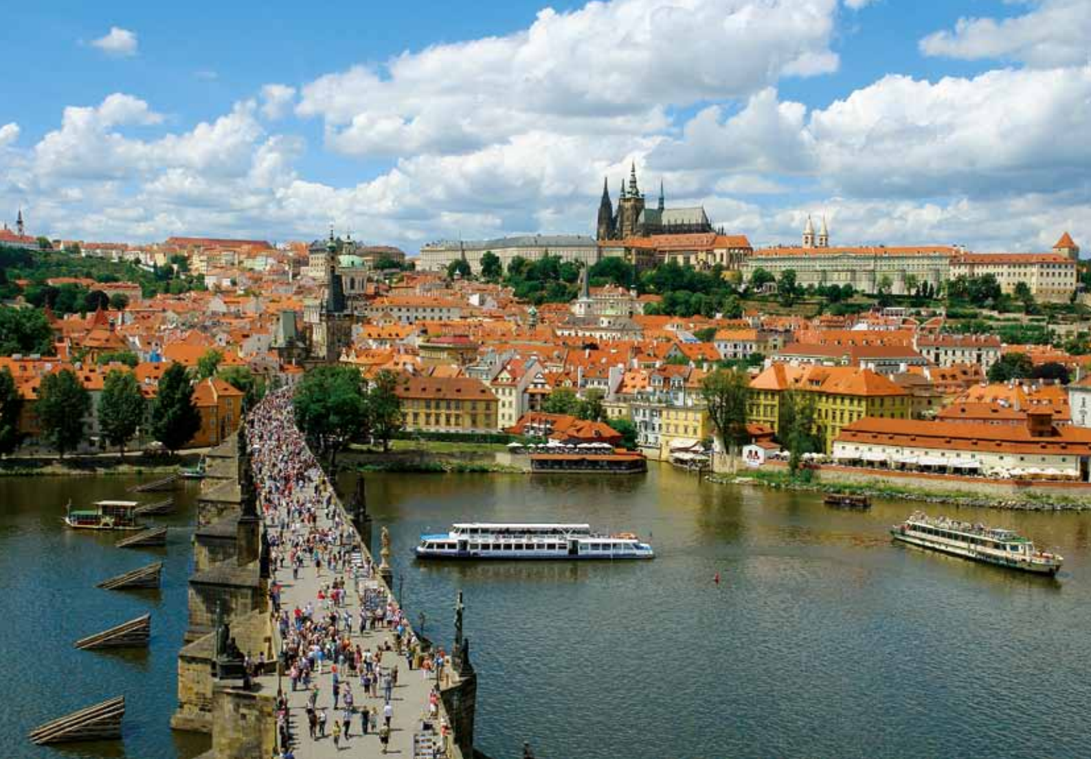
Panorama de Prague avec le Pont Charles et le Château de Prague