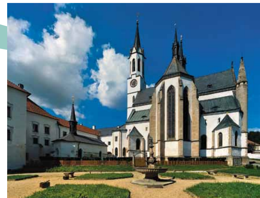
Monastère à Vyšší Brod