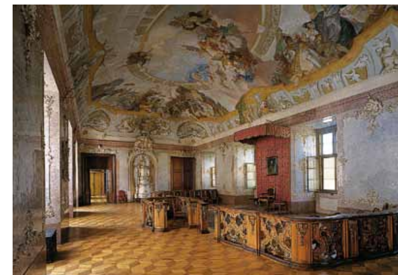
Intérieur de la salle du château de Kroměříž