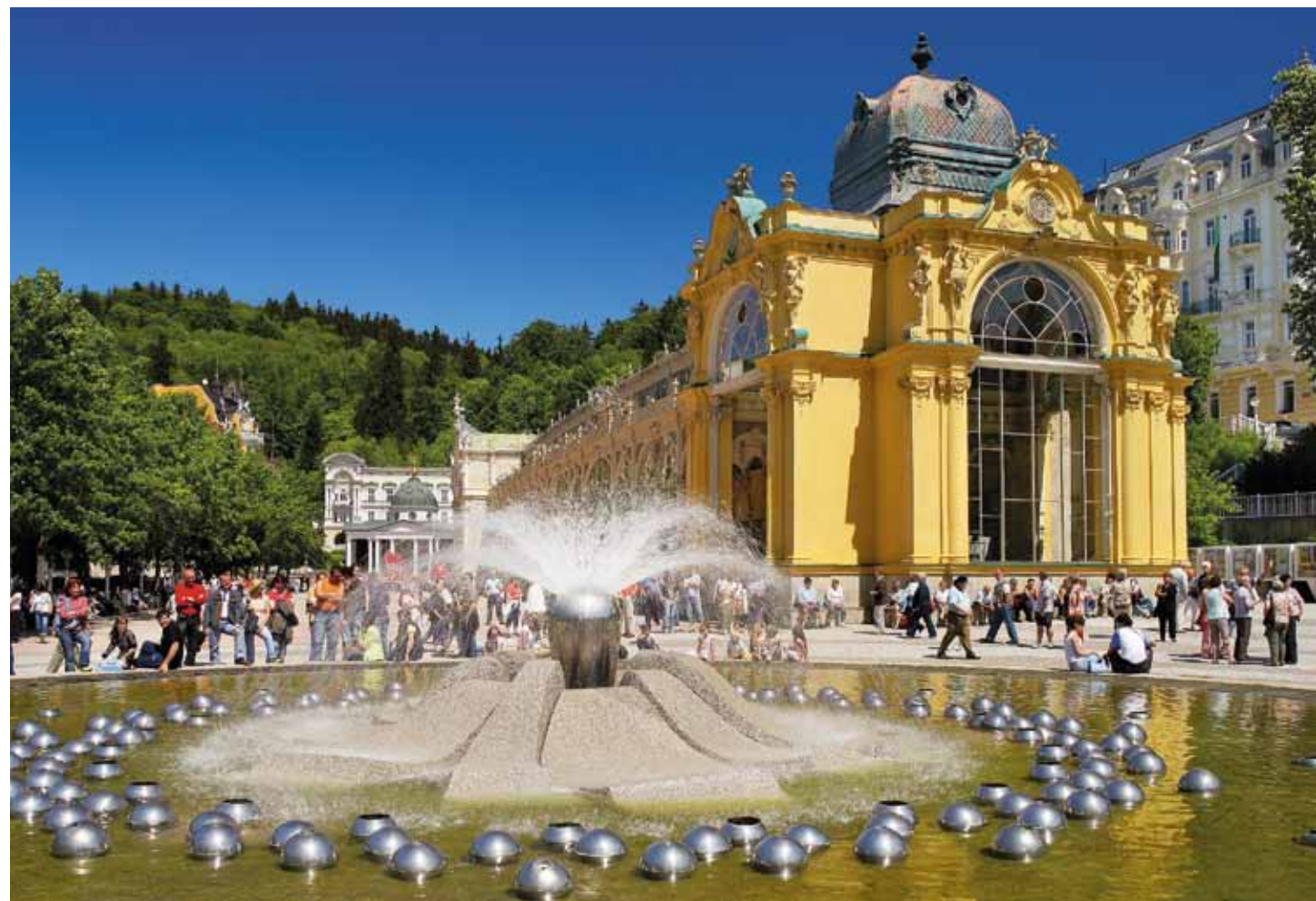
Fontaine chantante à Mariánské Lázně

Mitte Europa – festival culturel d'été à la frontière tchéco-allemande (Teplice) [ www.festival-mitte-europa.com ]