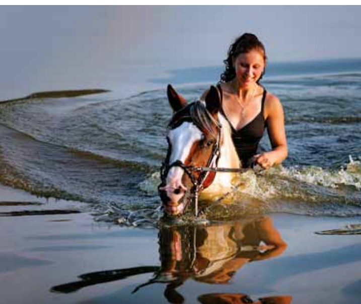
Equitation dans la nature

Si l'on peut parcourir la République tchèque confortablement, en une journée de voiture, il faudrait en revanche toute une vie pour la découvrir à pied. Depuis plus de cent ans, le Club de touristes tchèques s'investit dans le perfectionnement d'un dense réseau de routes piétonnes aux indications précises et d'itinéraires de ski d'une longueur de 40 000 kilomètres, complétés de cartes détaillées. Les Tchèques aiment le cyclotourisme et en hiver, les randonnées à ski de fond. Ces circuits balisés sont à votre disposition en toutes saisons. Ils vous donneront des informations pratiques sur les beautés naturelles et les événements historiques liés au paysage et vous conduiront jusqu'aux coins les plus reculés du pays et jusqu'aux zones les plus précieuses : les parcs naturels, les écosystèmes uniques, les réserves et les sites naturels protégés.