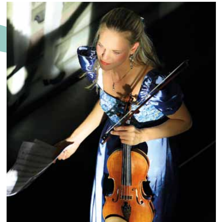
Concert à Český Krumlov