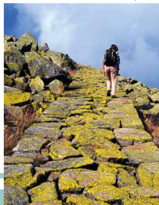
En allant à Vysoké kolo

Les images satellites de l'Europe centrale montrent un bassin flagrant, entouré d'une chaîne de montagnes : la République tchèque. Les montagnes suivent une grande partie des frontières de l'Etat, tandis qu'à l'intérieur du pays, on découvre un paysage très varié et accidenté. Des côtes légèrement ondulées alternent avec des plaines fertiles le long des rivières, avec des forêts profondes et des régions richement peuplées.