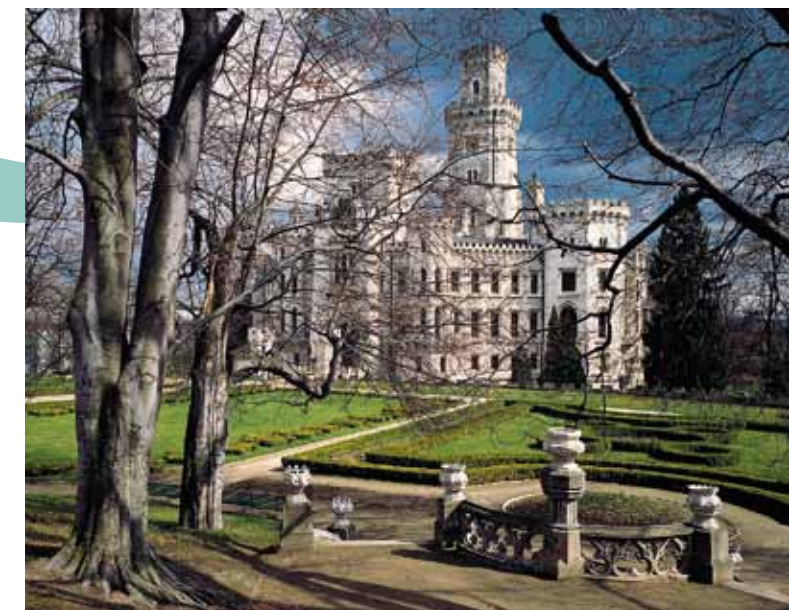
Château de Hluboká