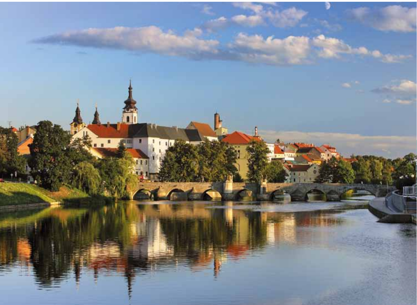
Ville de Písek en Bohême du Sud avec le plus vieux pont de Bohême

Edition M.I.P. Groupe SARL pour Czech Tourism Prague 2010 Text : © Yvonna Fričová & CzechTourism Traduction : © Agentura JAS spol. s r.o.