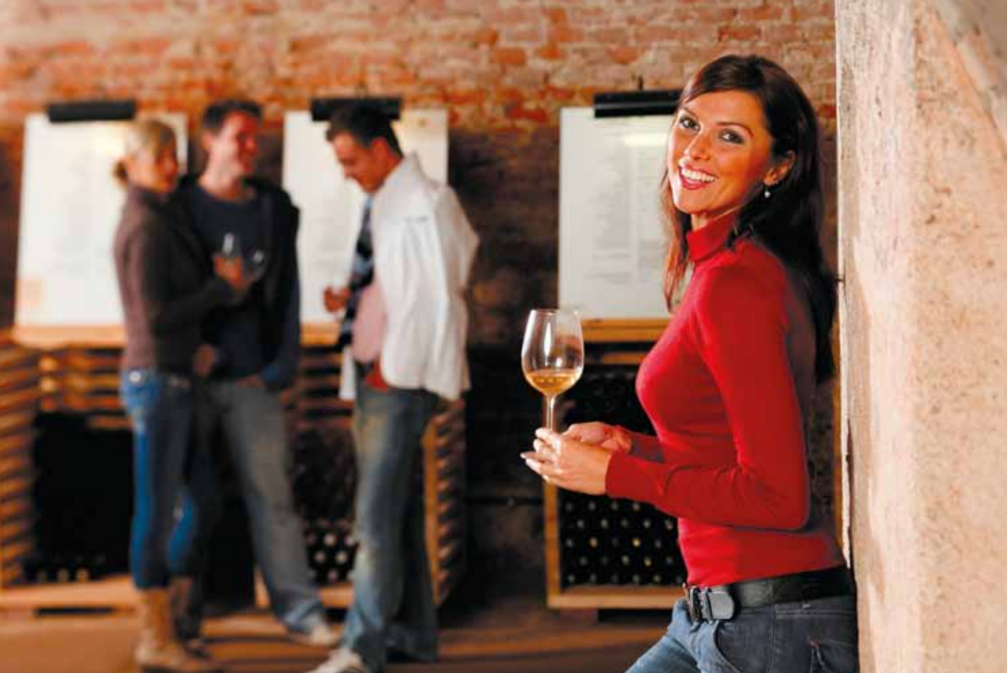
Salon des vins de la République tchèque à Valtice