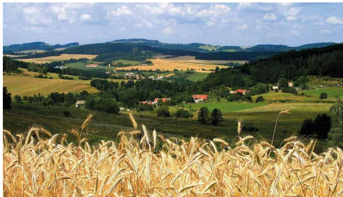
Paysage de Šumava

Šumava – toit vert de l'Europe [ www.npsumava.cz ]