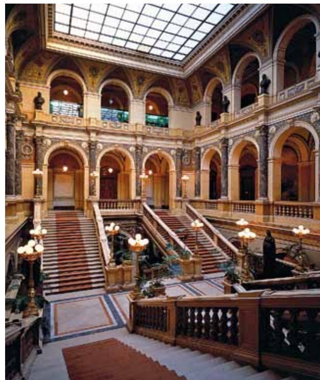
Intérieur du Musée national

A l'heure actuelle, les musiques d'Antonín Dvořák et de Leoš Janaček sont celles qui retentissent le plus souvent dans des salles de concert à l'étranger. Dans la deuxième moitié du XIX e siècle, Antonín Dvořák était considéré comme l'un des plus grands artistes de son époque. Sa célèbre Symphonie Du Nouveau Monde allait accompagner un siècle plus tard les premiers cosmonautes américains sur la Lune, l'excellence de la traditionnelle musique tchèque étant ainsi diffusée jusqu'à l'espace interstellaire. La musique est très présente en République tchèque et lors de votre visite vous aurez l'occasion de choisir dans la large offre de concerts et de festivals en tous genres, qui se tiennent au cours de l'année dans le pays, souvent dans le ravissant cadre de monuments historiques. Les amateurs d'arts plastiques et d'arts appliqués pourront découvrir d'intéressantes collections, des expositions temporaires ou permanentes. Outre des institutions officielles