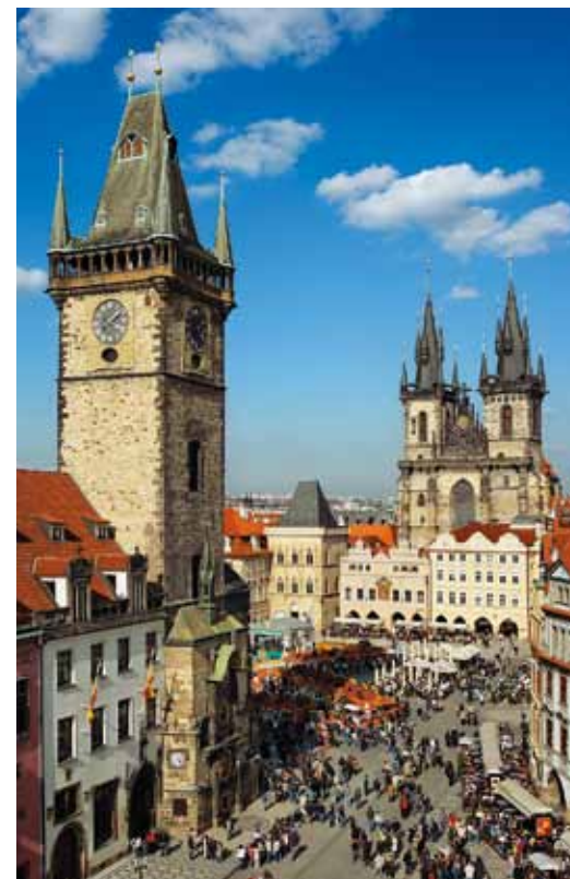
Place de la Vieille Ville

L'ambiance particulière de Prague a toujours été une source d'inspiration et de fascination pour les étrangers, du Moyen-âge à nos jours. Les quartiers historiques ont su garder leur charme : la Vieille Ville est un quartier magnifique possédant une université, un réseau de coupoles d'églises, les restes d'un remarquable ghetto juif et une vaste place centrale avec une horloge astronomique médiévale qui sonne toutes les heures ; le quartier de Malá Strana est disposé sur les coteaux du Château de Prague – c'est un labyrinthe de ruelles tortueuses et d'escaliers, un quartier riche en monuments religieux, en fastueux palais de la noblesse et en jardins raffinés ; Hradčany est un quartier pittoresque aux abords de l'imposant siège des souverains tchèques.