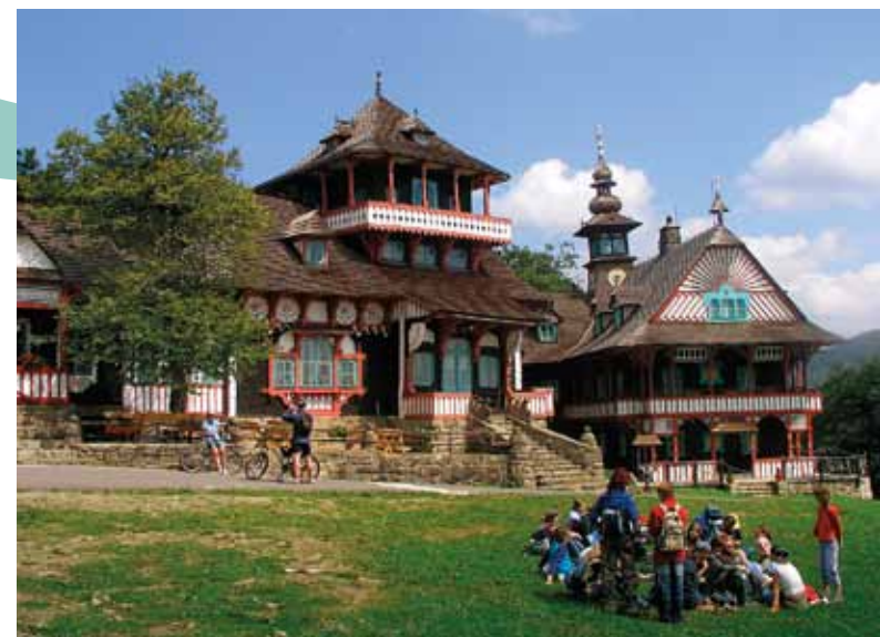
Pustevny dans les Beskides