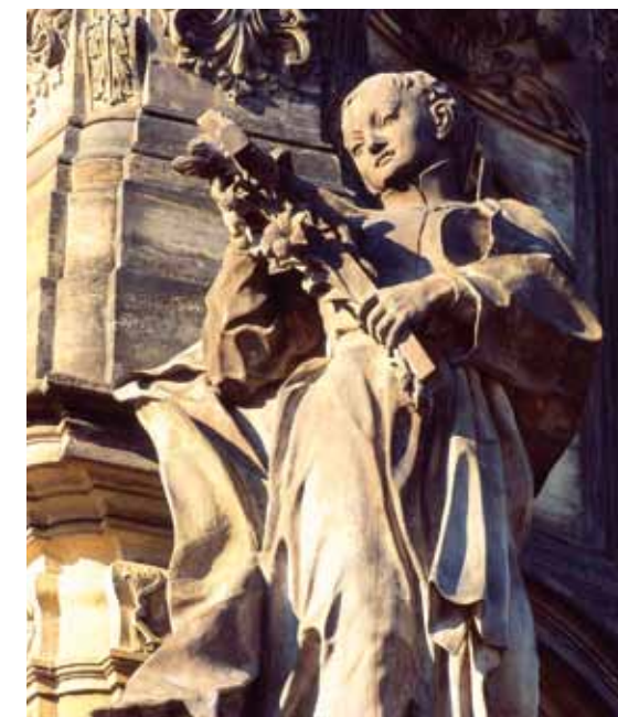
Détail de la colonne de la Sainte Trinité à Olomouc