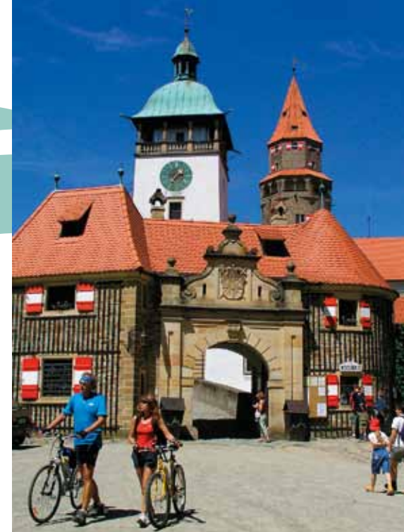
Château de Bouzov

arcades des villes de Litomyšl, Velké Losiny, Telč, et Jindřichův Hradec. D'autres encore, comme Český Krumlov, Vranov, Lednice, Valtice, Bouzov, illustrent parfaitement l'évolution des différents styles architecturaux qu'a connue l'Europe centrale au cours de son histoire. La visite des intérieurs somptueux abritant des collections extraordinaires ou de remarquables jardins, parcs et enclos fait également partie des circuits touristiques. Des festivités historiques, des visites nocturnes, des pièces de théâtre ou des concerts se déroulent dans ces différents sites.