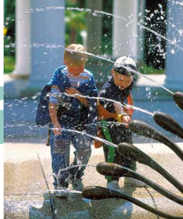
Des enfants près de la fontaine

Festival de musique Janáček à Luhačovice [ www.janacek.cz/festival-luhacovice ]