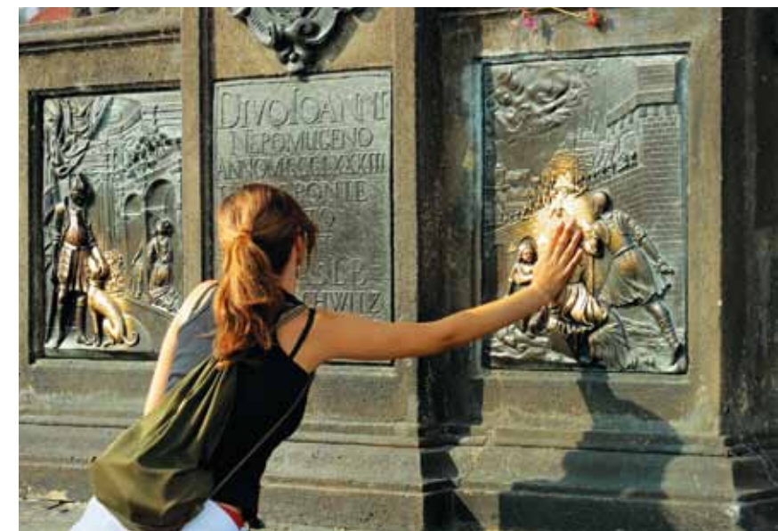
Pont Charles – porte-bonheur