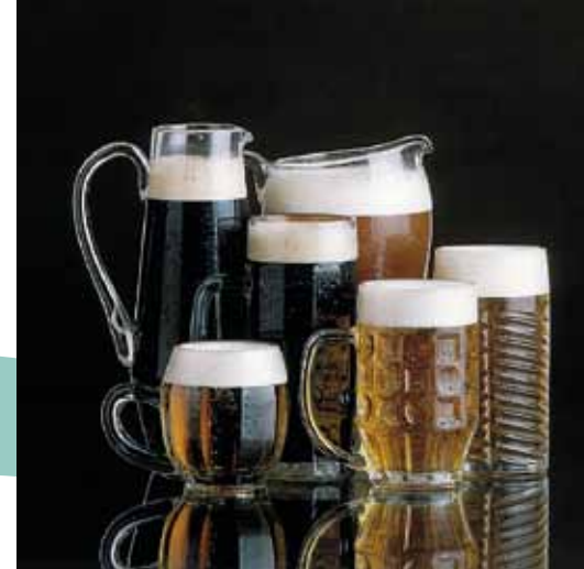
La bière est la boisson tchèque préférée

La bière tchèque est un véritable joyau national. Des dizaines de brasseries la préparent, selon des formules très anciennes et à partir de matières premières locales d'excellente qualité. Il n'est point étonnant donc, que les Tchèques soient les plus gros consommateurs de bière au monde. Les vins tchèques et moraves, notamment les vins blancs, atteignent aussi une très bonne qualité. C'est la Moravie du Sud qui est la principale région viticole du pays. Des circuits viticoles préparés pour les visiteurs mettent à l'honneur le vin, les caves à vin, ainsi que le patrimoine et les dernières traditions populaires conservées dans cette région dont l'hospitalité de ses habitants bénéficie d'une grande notoriété.